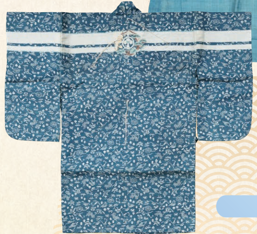
鶴亀に宝尽くし文様一つ身