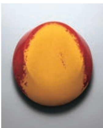
佐々木類《植物の記憶うつろい如月》2024年 作家蔵