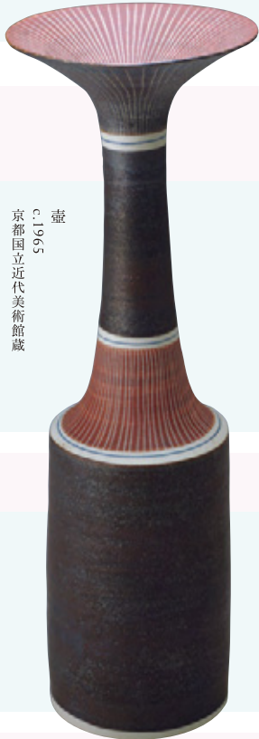
壺 c.1965 京都国立近代美術館蔵

●( )内は20名以上の団体料金および割引料金 ●いずれも消費税込 ●中学生以下、障害者手帳 をご提示の方とその付添者(1名)は無料 ●いしか わ文化の日(10/19)および文化の日(11/3)は割 引料金 ●3展覧会相互割引「北斎・広重 大浮世 絵展」(石川県立美術館)、「ミニチュアドールハウ スの世界展」(金沢21世紀美術館)の半券をお持ち の方は割引料金 * Prices in parentheses are for groups of 20 persons or more, and for coupon holders. * Admission is free for junior high school students, and those with Disability Certificates and one caregiver accompanying each of them. * All prices include tax.