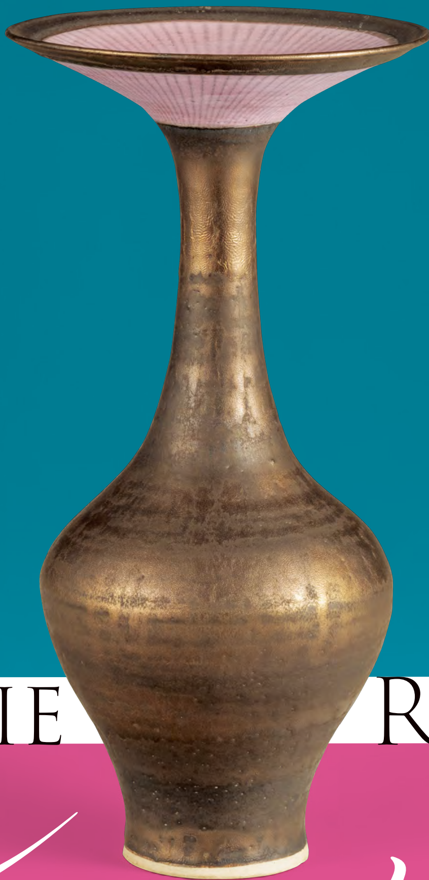
ブロンズ軸花器 c.1980 井内コレクション(国立工芸館寄託)

開館時間：午前9時30分～午後5時30分（入館は閉館の30分前まで） 休館日：月曜日（ただし9月15日、10月13日、11月3日、24日は開館）、9月16日、10月14日、11月4日 主催：国立工芸館、北陸中日新聞 特別協力：井内コレクション、京都国立近代美術館 協賛：DNP大日本印刷 September 9 - November 24, 2025 Hours: 9:30~17:30 Admission until 30 minutes before closing. Closed: on Mondays (except September 15, October 13, November 3, 24), September 16, October 14 and November 4 Organizer: National Crafts Museum, The Hokuriku Chunichi Shimbun