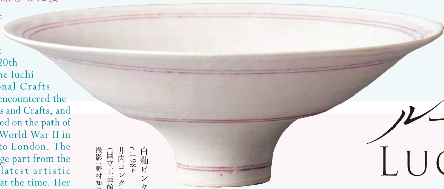
白釉ピンク線文鉢 c.1984 井内コレクション (国立工芸館寄託)

移転開館5周年記念 In commemoration of the fifth anniversary of the museum's relocation