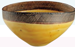
黄釉鉢 c.1958 井内コレクション (国立工芸館寄託)