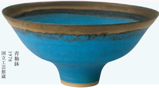
青釉鉢 1978 国立工芸館蔵