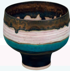
ピンク象嵌小鉢 c.1975-79 国立工芸館蔵