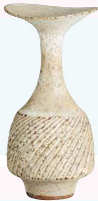
白釉鎔文花瓶 c.1976 国立工芸館蔵 撮影・品野皇