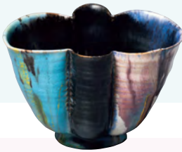
カップ c.1926 個人蔵