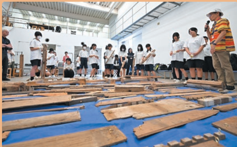
ワークショップ「ニットとノット」活動風景

美術館を舞台に繰り広げられた、中学生、アーティスト、先生たちが考え、体験し、形にした世界をどうぞご覧ください。