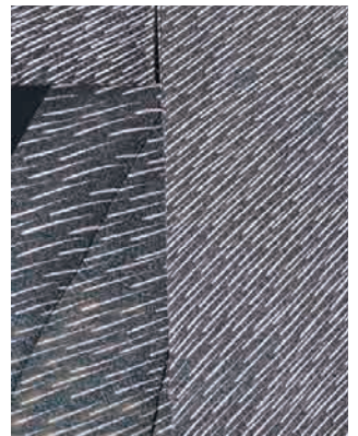
森口華弘《訪問着 薫秋》(部分) 1964