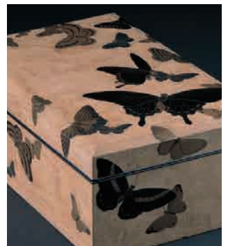
高野松山《群蝶木地蒔絵手箱》(部分) 1963