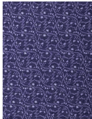
小宮康義《江戸小紋 着尺「ゲンガー・ゴースト」》(部分) 2022