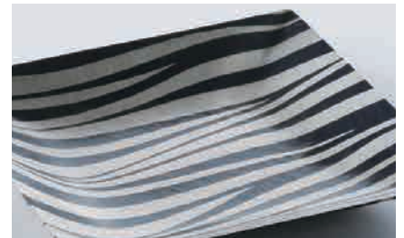
関谷四郎《赤銅銀接合皿》(部分) 1972